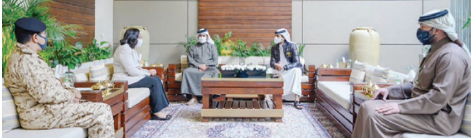
○ جانب من الاستقبال

حمد آل خليفة التوصيات التي خرج بها مؤتمر طب القلب الرياضي، مؤكدا سموه أن التوصيات ستكون محل اهتمام ودراسة. من جانبها تمثنت فائقة بنت سعيد الصالح الاهتمام الكبير من قبل سمو الشيخ ناصر بن حمد آل خليفة بمؤتمر طب القلب الرياضي ورعاية سموه لهذا المؤتمر المهم الأمر الذي ساهم في نجاحه ووصوله إلى الأهداف التي وجد من أجلها في حماية وتشجيع ممارسي الرياضة، مؤكداً أن المؤتمر خلص إلى توصيات مهمة ستكون قاعدة لتشر الوعي الصحي بين ممارسي الرياضة وتوفر بيئة رياضية آمنة لهم عبر ممارسات سليمة.