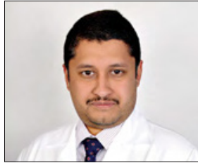
خالد بن ثاني

التخصصي لمساعدتهم على الحفاظ على صحتهم، مشيراً إلى أن الخدمات الصحية المقدمة تعد من الخدمات المميزة التي تقدم على مستوى الخليج العربي، مشيراً إلى أن المستشفى يقدم برنامجاً متطوراً يشرف عليه الطاقم الطبي المختص لمساعدة مرضى القلب على التماثل إلى الشفاء والوقاية من الانتكاسات المستقبلية، ويتضمن البرنامج مجموعة من التمارين الطبية إلى جانب التوعية والتثقيف حول أفضل الوسائل التي يجب اتباعها للحفاظ على سلامة القلب وتقديم الاستشارات الطبية ومساعدة المرضى على العودة لحياة مؤلها النشاط والحيوية». وأفاد بأن تأهيل المرضى يساعد على التعافي بعد الإصابة بنوبة قلبية أو إجراء جراحة في القلب، والحيولة دون ملازمة المستشفى مستقبلاً وتجنب اضطرابات القلب أو الوفاة بسبب مضاعفات أمراض القلب، إلى جانب تحديد وعلاج الأسباب المؤدية إلى أمراض القلب والشرايين ومشاكل القلب الأخرى لدى المرضى، وتشجيع المرضى على اعتماد تغييرات صحية لنمط الحياة. وهذه التغييرات قد تشمل الأنظمة الغذائية الصحية وزيادة النشاط البدني وتعلم كيفية التعامل مع الإجهاد والحفاظ على الصحة بسبب طبيعة حياة كل مريض.